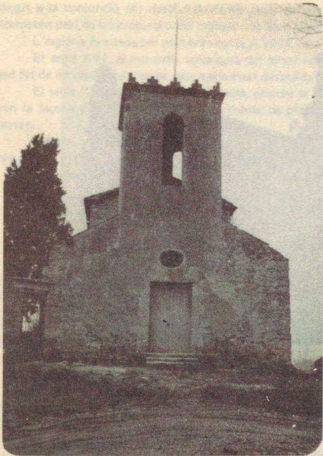
← Sta. MARIA DE CAMPANYÀ